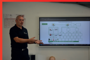
Mise en situation au moyen de cas concrets