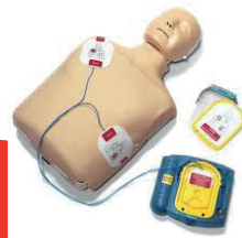
Pratique de la réanimation cardio-pulmonaire simulée